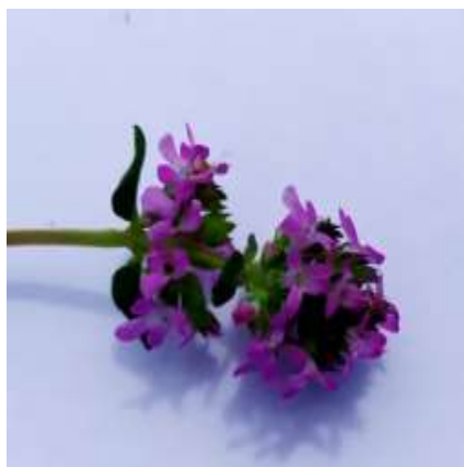
група 4 пурпурове