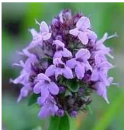
група 5 фіолетове