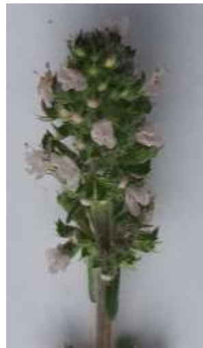
3 видовжено- циліндричне