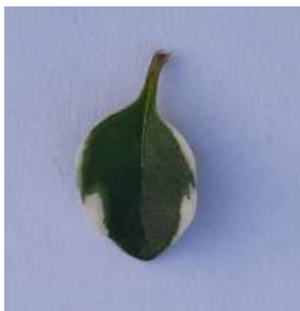
1 по краю

До пункту 25 Таблиці ознак. Листкова пластинка: поширення вторинного забарвлення