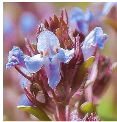
група 6 блакитне

До пункту 38 Таблиці ознак. Для сортів із двокольоровим віночком. Верхня губа: вторинне забарвлення внутрішнього боку