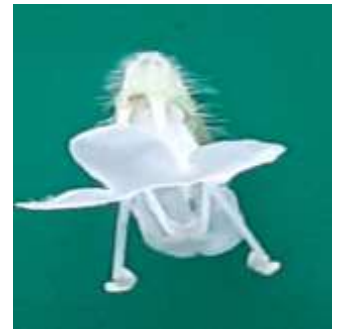
9 різної довжини

До пункту 45 Таблиці ознак. Рослина: час початку цвітіння