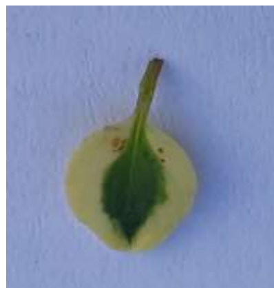
2 у центральній зоні

До пункту 26 Таблиці ознак. Суцвіття: за довжиною, см 3 – коротке – до 2; 5 – середнє – 2-5; 7 – довге – понад 5.