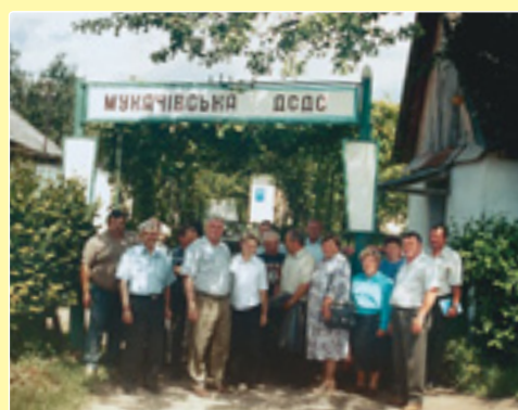
Колектив Мукачівської ДСДС