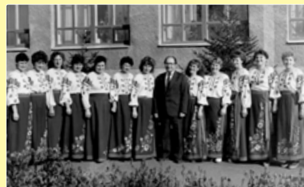
Колектив художньої самодіяльності НДЦ «Південний»