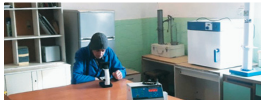
Лабораторне приміщення Кіровоградської філії УІЕСР, 2021 р.