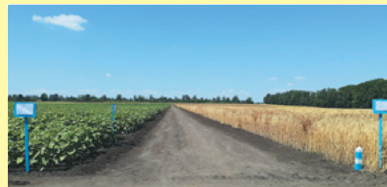
Загальний вигляд дослідних ділянок Кіровоградської філії УІЕСР, 2021 р.