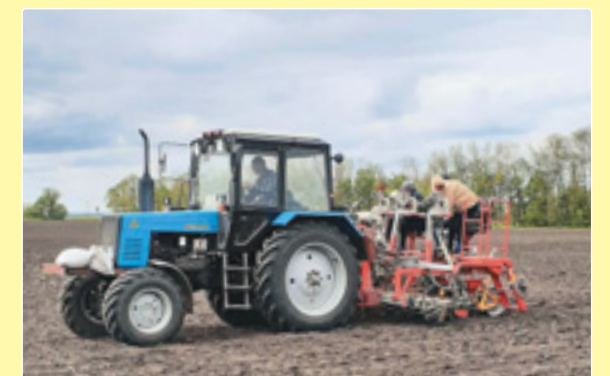
Сівба гібридів кукурудзи звичайної, 2021 р.