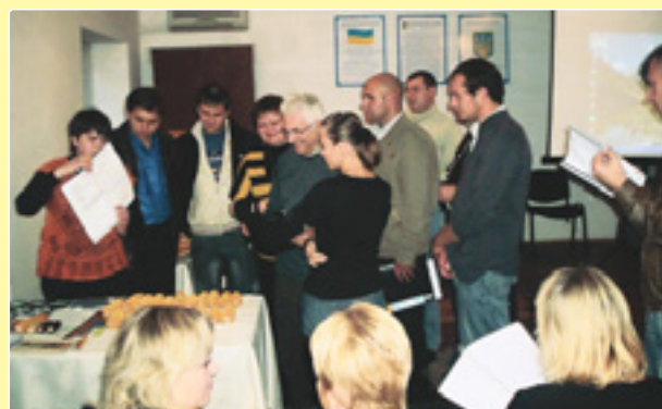
Навчальний семінар з проведення ґрунт-контролю для фахівців Кіровоградської ДСДС, 2009 р.