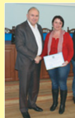
Підвищення кваліфікації працівників філії, 2019 р.