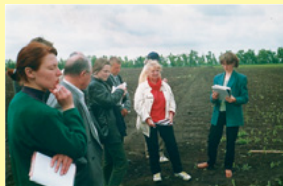
Перевірка дослідів з ВОС-тесту на Кіровоградській ОДСВС