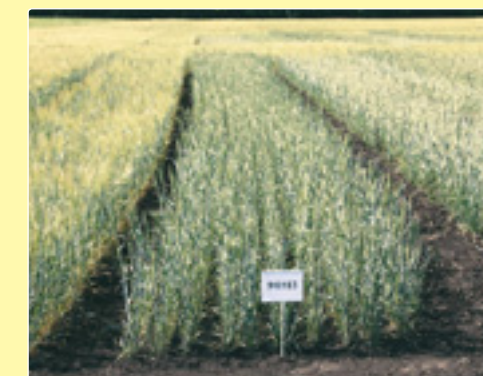
Експертиза сортів зернових на ПСП