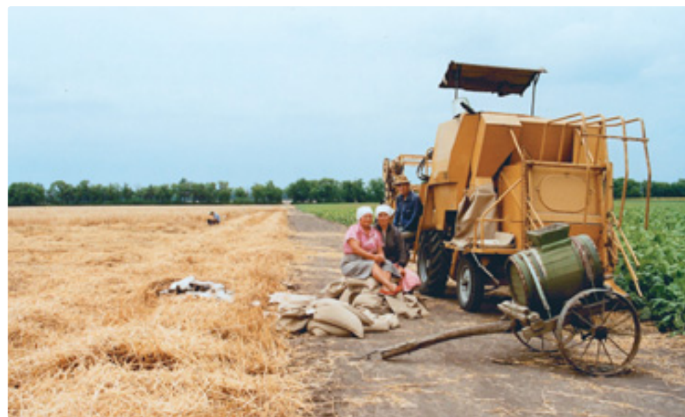
Збирання озимих зернових на дослідних ділянках, НДЦ «Південний»

покращувалась матеріально-технічна база, підвищувалась урожайність випробовуваних сортів. Середня врожайність пшениці озимої по чорному пару досягла 50,6 ц з гектара. Найкращим агротехнічним строком висіву пшениці визнано 15–20 вересня.