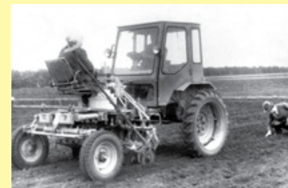
Сівба на дослідних ділянках, НДЦ «Південний»