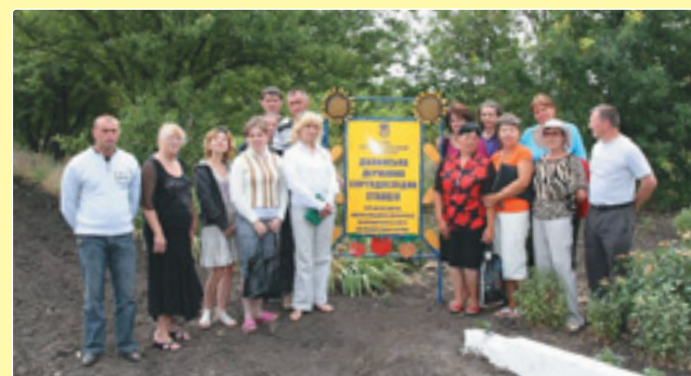
Перевірка стану дослідів на Долинській ДСДС, 2011 р.