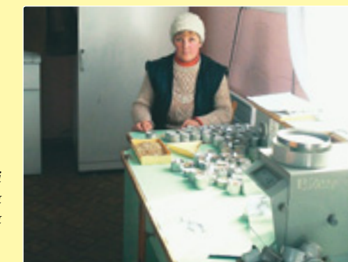
Лабораторні дослідження насіння зернових, 2004 р.