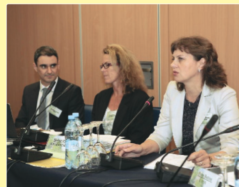
42-а сесія Технічної робочої групи з польових культур Міжнародного союзу з охорони нових сортів рослин, м. Київ, 2013 р.