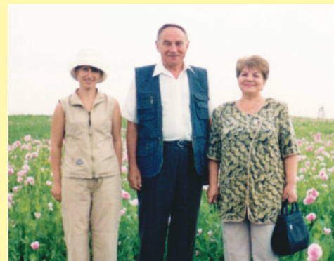
На дослідному полі заявника