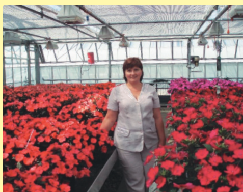
Підвищення кваліфікації з ВОС-тесту квіткових культур у спорудах закритого ґрунту, м. Ганновер, Німеччина, 2010 р.