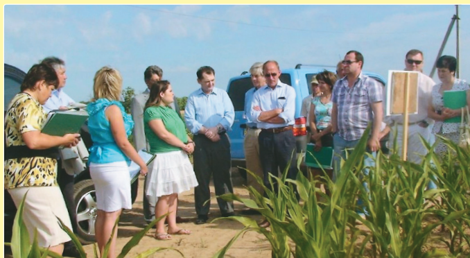
Робоча місія ОЕСД з оцінювання стану організації ділянкового (грунтового) та лабораторного сортового контролю на базі Київського ОДЦЕСР, 2010 р.